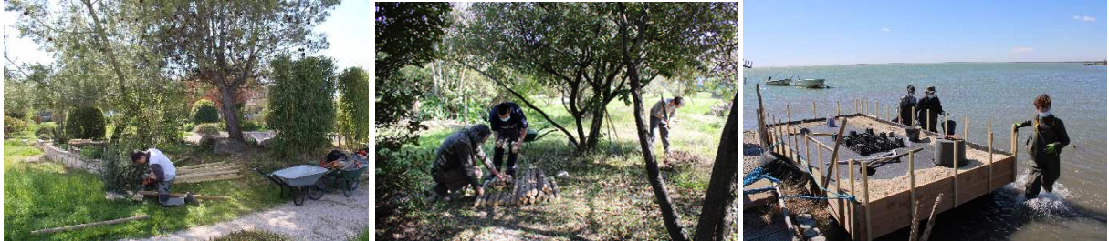
PNR de Camargue, Mars 2021, Étang de Vaccarès - Gestion des milieux naturels du littoral