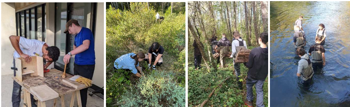
LPO PACA, Jardins du lycée, Juin 2021, Agir pour la biodiversité – Observation et préservation des espèces

Les notions de développement durable et d'agroécologie sont déjà présentes dans la vie de l'établissement dans les différentes formations, dans les choix des thématiques, dans les enseignements à l'initiative de l'établissement et dans les actions du récent club éco-délégués.